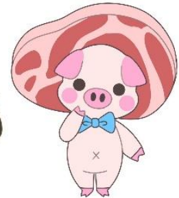
霧里ポーク(商標登録)