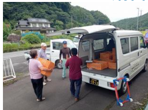
マックスバリュ出荷