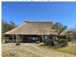
清流の館(昼食場所)