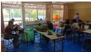
ガーデンハックルベリー収穫加工作業